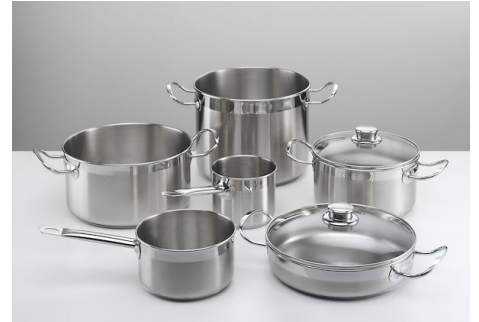
Série de pots induction PRO 8pcs. 8210 008